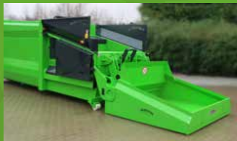
BODENHÖHE. Befüllung ohne Rampe – Schüttgut lässt sich einfach umladen.