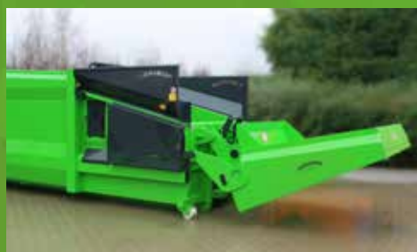
RESTLOS ENTLEREEN. Komfortable Betätigung der Kippfunktion über die Bedientastatur – kein Material fällt daneben.