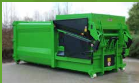
DECKELFUNKTION. In Transportstellung ist die Einfüllöffnung vollständig geschlossen.